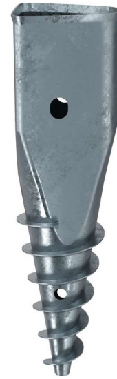
KSF X 135x480-LPS