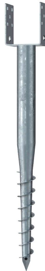
KSF U 60x730-111

Technische Änderungen vorbehalten! Produkt für den beruflichen Gebrauch nach Instruktion.