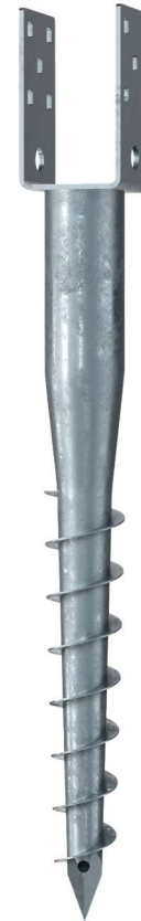
KSF U 60x730-71