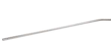
Eindrehstange lang 2,40 kg Art.-Nr. 24805