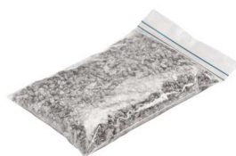
Spezialgranulat 0,50 kg Art.-Nr. 21823