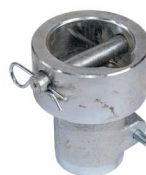
Eindrehadapter: Z1 Aufsatz-A68 Art.-Nr. 21833