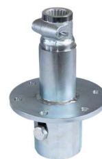
Eindrehadapter: Z1 Aufsatz-I114 Art.-Nr. 21894