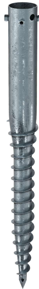
KSF G 114x1300-4xM16

Technische Änderungen vorbehalten! Produkt für den beruflichen Gebrauch nach Instruktion.