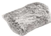
Spezialgranulat 1,50 kg Art.-Nr. 21824