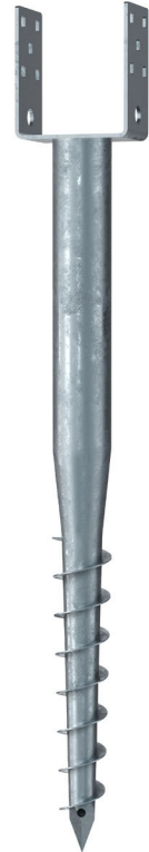
KSF U 60x730-111