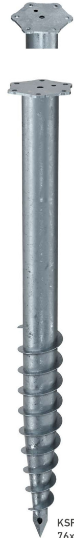
KSF M 76x1000-M12