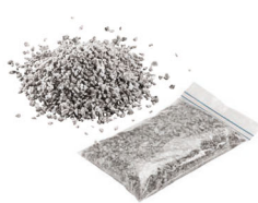
Spezialgranulat 0,50 kg Art.-Nr. 21823