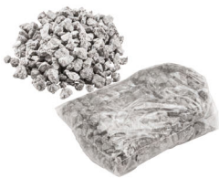
Spezialgranulat 1,50 kg Art.-Nr. 21824