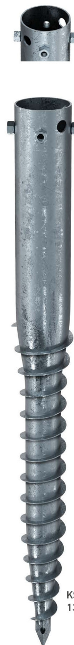
KSFG G 114x 1300-4xM16

Eindrehstange lang 2,40 kg Art.-Nr. 24805